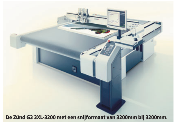
De Zünd G3 3XL-3200 met een snijformaat van 3200mm bij 3200mm.

Dergelijke constructies vragen echter een pak meer snijbewegingen, waardoor de bestaande machine dan weer minder beschikbaar was voor andere jobs. Hierover zegt medezaakvoerder Gerd Mouton het volgende: "Pancartes, banners en ander dergelijk materiaal zijn makkelijk en snel te versnijden doordat het aantal snijbewegingen beperkt is. Bij andere